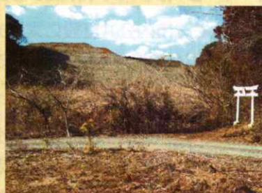
大野地区の残土状況を視察して参りました。